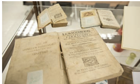
Museo della Farmacia Unifarco - Via Cal Longa, 62 - Santa Giustina (BL)